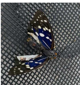
奇形のため短命に 終わったオオムラサキ

同様に、世界の貧困地域の飢餓をなくすために、自分の国を離れて移民となることを勧める政策も、食料を送って支援することも問題の根本的解決にはならないことが分かります。富士見小学校のオオムラサキに関して言えば、新オオムラサキハウスのエノキを生長させ、たくさんの葉を毎年茂らせることが一番大切です。つまり、オオムラサキを育てるならエノキを育てなければなりません。これからは、エノキをどうやって茂らせるかに取り組んでいきます。同様に、貧困地域で飢餓をなくすためには、食べ物を送るだけではなく、食料を生産できるような環境を整えたり、食料生産技術を教えたりすることが大切です。