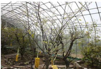
葉が全くない 新オオムラサキハウスのエノキ

2030年までに持続可能な世界をつくるため、国連が定めた目標が17あります。その1番目が「貧困をなくそう」、2番目が「飢餓をゼロに」です。日常生活で今まで日本の豊かさを実感することはありませんでしたが、最近の米価高騰で主食のお米が食べられなくなるのでは、備蓄米はいつ店頭に並ぶのかと、にわかに世間の関心を集めています。しかし、そんな現状でも、家族がしっかり食事を用意してくれているので、こどもたちにとっては貧困や飢餓は実感のないお話でしょう。