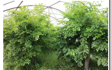
葉が生い茂っている 旧オオムラサキハウスのエノキ

もう1つの方法は、食料を送る方法です。エノキの葉が付いた枝を切って、幼虫がいるところに持ってきます。かつて300頭以上飼育したときには、街路樹のエノキの枝をたくさん切って、水を入れた一升瓶に挿して、幼虫が食べられるようにしたそうです。しかし、問題点は、切った枝ではすぐに葉が枯れてしまうことです。しかも、持続可能な支援ではありません。